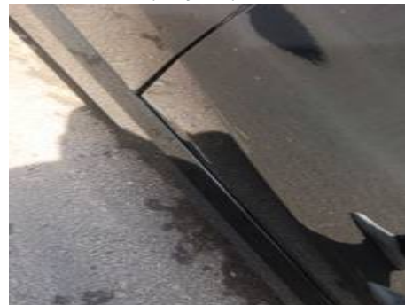
Porte avant droite (Rayure)