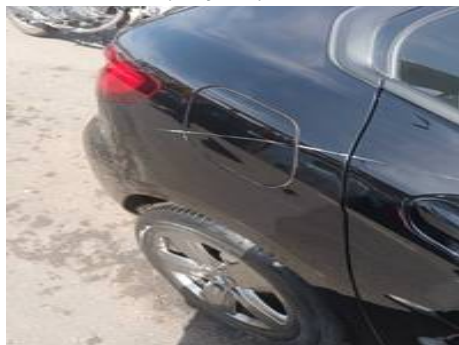
Aile arrière droite (Rayure)