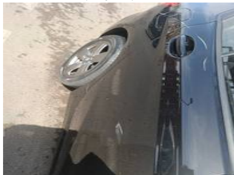
Porte arrière droite (Rayure)